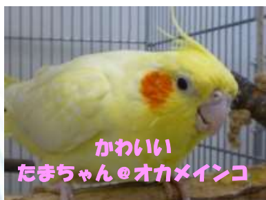
かわいい たまちゃん@オカメインコ