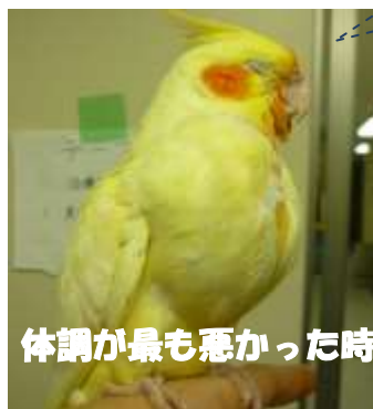
体調が最も悪かった時

一気に水を飲んだため、胸(そのう)がパンパンになりました。口の周りが赤いのはビタミン剤の色です。健康上問題はありません。現在では体調も良化しており、このような姿を見ることはなくなりました。ショッキングな写真で申し訳ございません。