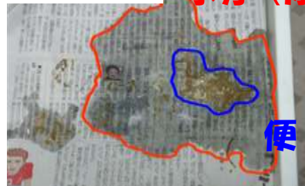
オカメインコの多尿 水分(尿)

軽ければ軽い程、%の値は高くなる傾向があります。同じ種類、同じ体重であっても、その鳥によってベストの飲水量は異なりますので、健康な状態での飲水量を把握しておく事をお勧め致します。飲水量を測っておかしいなと思ったら、一人で解決しようと思わず、一人で解決しようと思わず、獣医さんに相談しましょう。