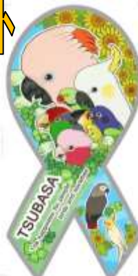
Design by Jun

お車に付けていただく事で、走る TSUBASA の広告塔に皆様になっていただけましたら 嬉しいです。