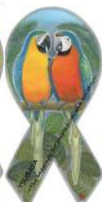
Design by norisan